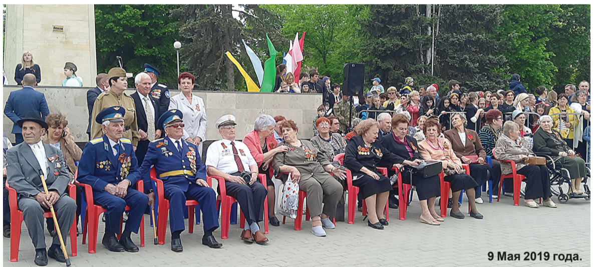
9 Мая 2019 года.

Также правительство республики оказывает действенную помощь малому и среднему бизнесу за счет разнообразных инструментов поддержки.